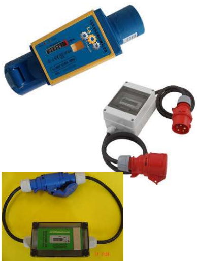
Illustration mulige løsninger